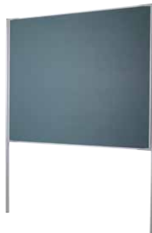
Stellwände, B 158 x H 190 cm

Beidseitig nutzbar. Inkl. 2 Säulen zur Aufnahme der Stellwandfüße. Maße: Tafelfläche 150 x 120 cm.