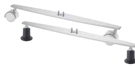
T-Fuß für Stellwandsäule

Fahrbar mit feststellbaren Rollen (Ø 50 mm) oder fest stehend mit Tellergleitern (Ø 50 mm). Material: Stahl- Formteil mit pulverbeschichteter Oberfläche in Weißaluminium (RAL 9006); Rollen und Gleiter aus Kunststoff, schwarz (RAL 9005) bzw. Weißaluminium (RAL 9006). Fußlänge: 54 cm.