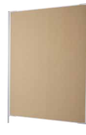
Stellwände, B 128 x H 160 cm

Beidseitig nutzbar. Inkl. 2 Säulen zur Aufnahme der Stellwandfüße. Maße: Tafelfläche 120 x 150 cm.