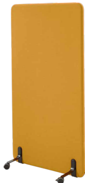
Akustik-Trennwand mit Fuß

Bepinnbar. Absorberklasse A (höchste Stufe). Material: Polyester.